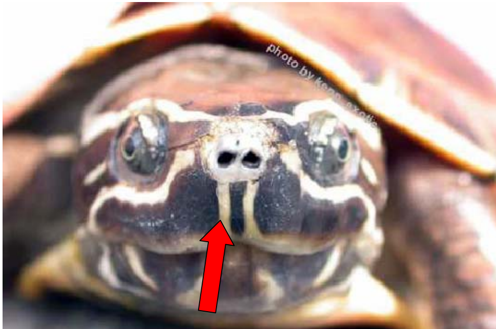
ภาพที่ 1. แสดงจำนวนเส้นใต้จมูก (Nasal strip) ของ M. macrocephala ที่มา : www.siamreptile.com/webboard/webboard_show.php?id=13866