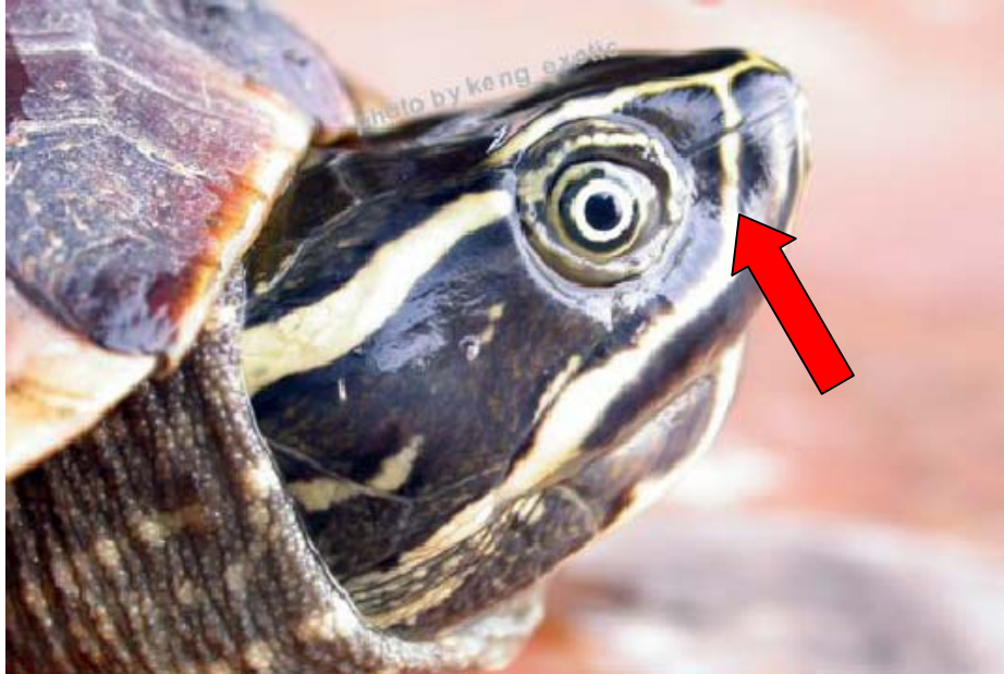
ภาพที่ 4. แสดงเส้นขาวใต้ตา (Infraorbital strip) ของ M. subtrijuga ส่วนที่เป็นเส้นต่ออ้อมไปด้านหน้าของตา (loreal seam) ๐๕'๐'กว้าง