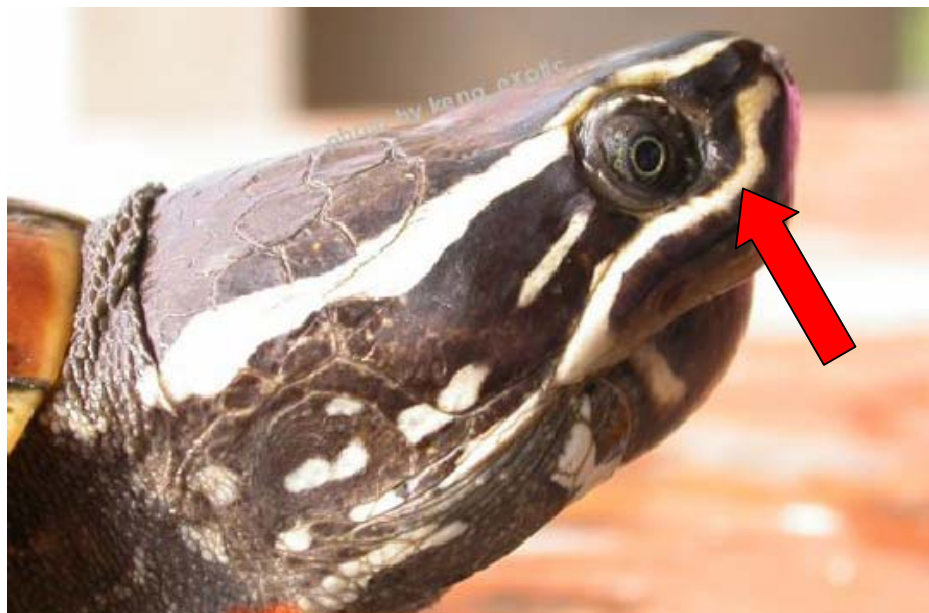
ภาพที่ 3. แสดงเส้นขาวใต้ตา (Infraorbital strip) ของ M. macrocephala ส่วนที่เป็นเส้นต่ออ้อมไปด้านหน้าของตา (loreal seam) มีขนาดกว้าง